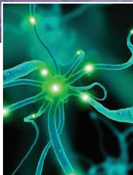
RÉGÉNÉRATION DES NEURONES

Le sommeil constitue une source particulière de régénération. Chaque nuit, le corps épuisé plonge dans la sphère anabolique de l'Argent (Lune) et en ressort frais et dispos. Pendant le sommeil inconscient, a lieu un processus de construction, de régénération. De leur fait, aucune perception ne nous est possible dans cet état.